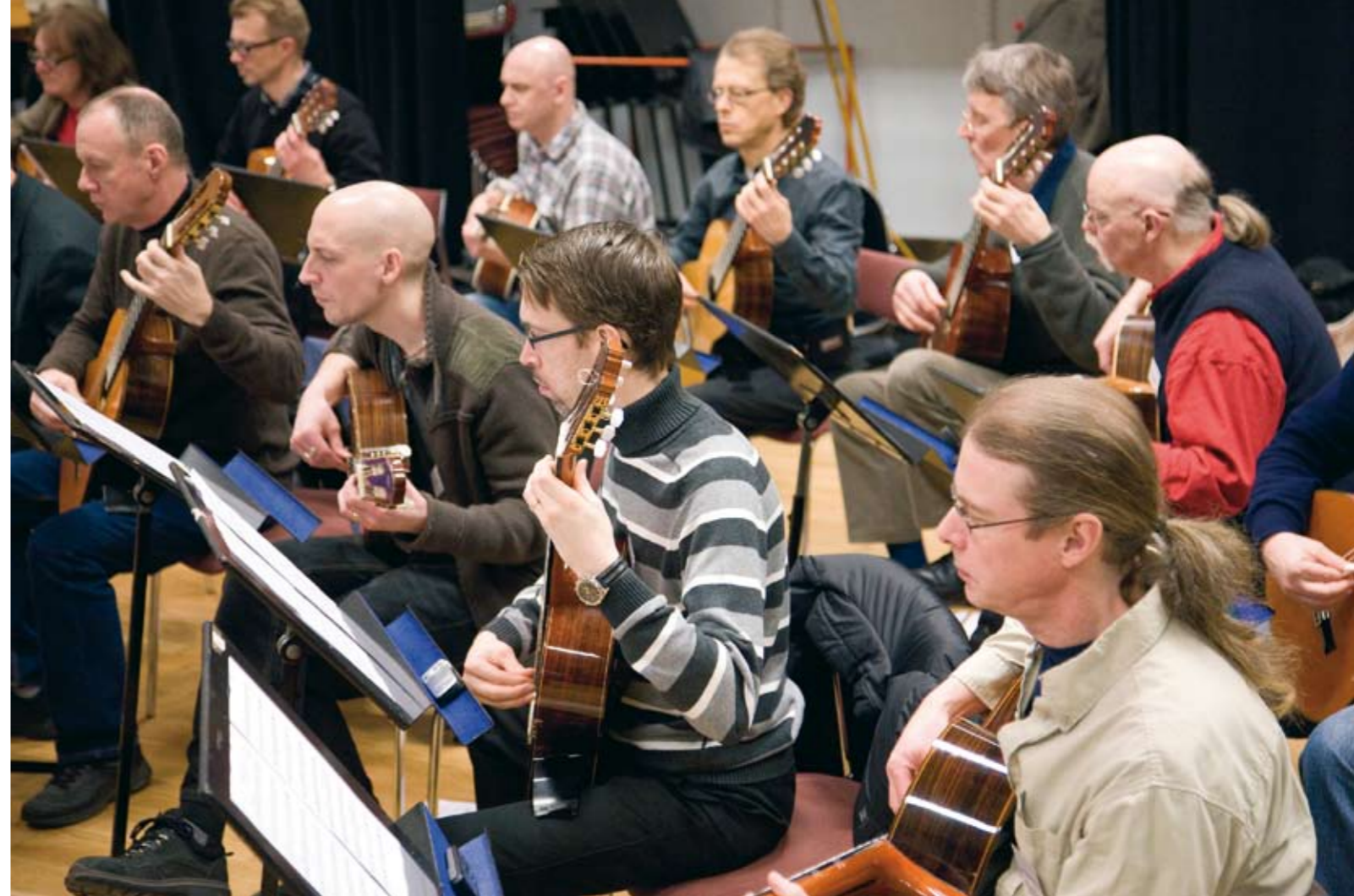
Gitarrorkestern jobbade med full koncentration!

Mellan programpunkterna gavs möjlighet att botanisera i en notutställning som öppnats för alla deltagare som ville visa upp noter, undervisningsmaterial, CD-skivor med mera. Till och med gitarrer för provspelning fanns tillhanda.