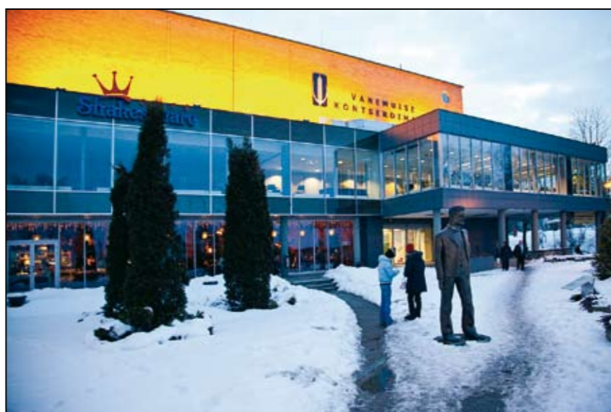
Vanemuise konserthus i Tartu (Estland)

I pausen – efter att applåderna och jublet för Bruchs violinkonsert klingat ut – går jag ut i foajén och träffar där några av de litauiska brassmusiker som var utbytesstudenter på Musikhögskolan ”på min tid”, snackar lite gamla minnen och