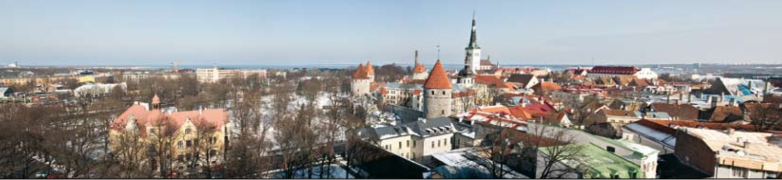
Panoramavy över Tallinn

soundcheck i Estonia konsertsal – en underbart vacker konsertsal med kristallkronor i taket och utmärkt akustik – ett soundcheck inför TV-kameror, radioinspelning och med intervjuer av dirigent och solist. Sammantaget inramningen och orkestrens laddning inför final gjorde en helt fantastisk avslutande konsert (jag log hela Stenhammar!). En stor och