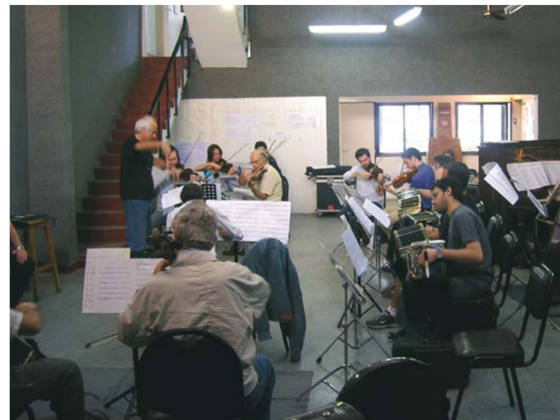
Orquesta del tango de Buenos Aires.