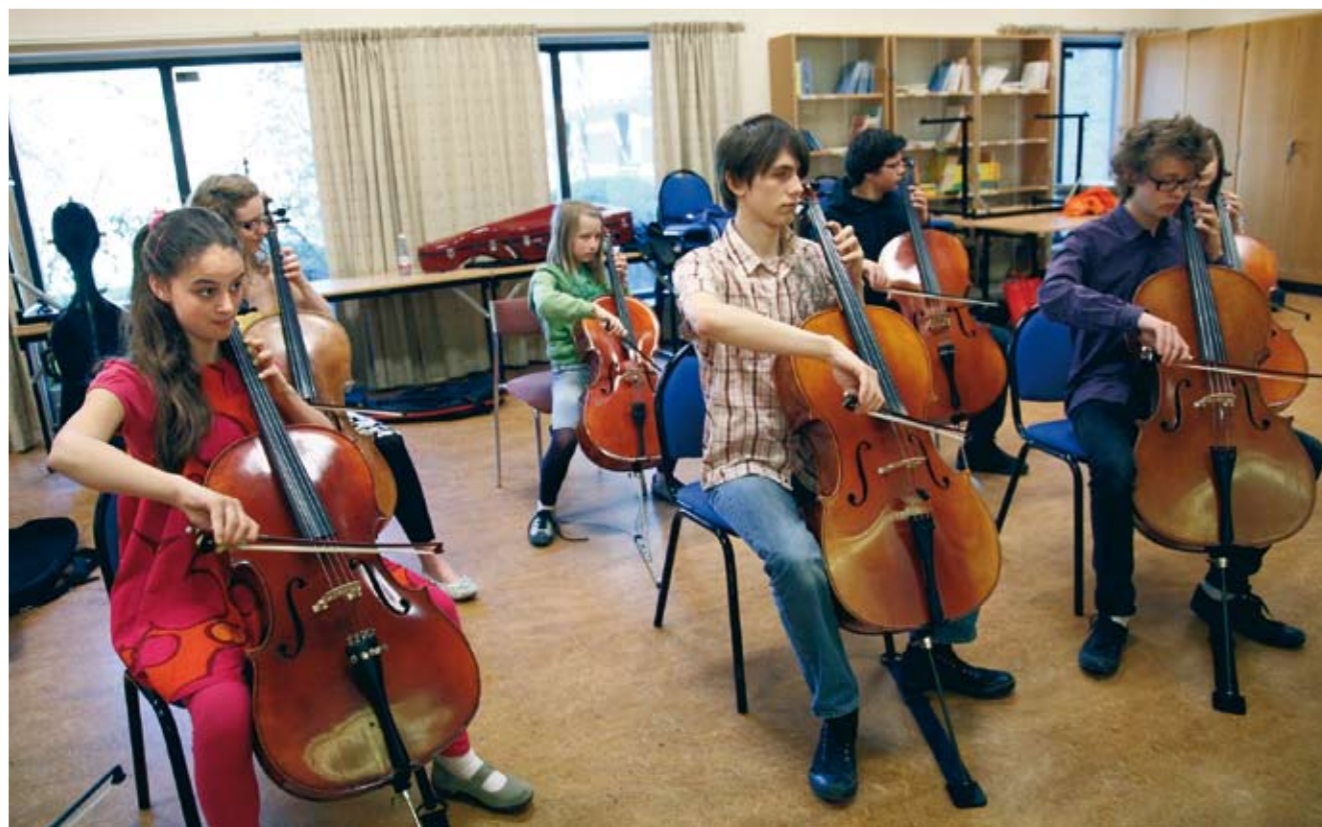
Cello ingår sedan 9 år tillbaka i Stråkforums utbud.