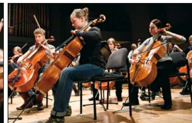
Våra cellister, väl fokuserade på uppgiften, i Vanemuise konserthus, Tartu.