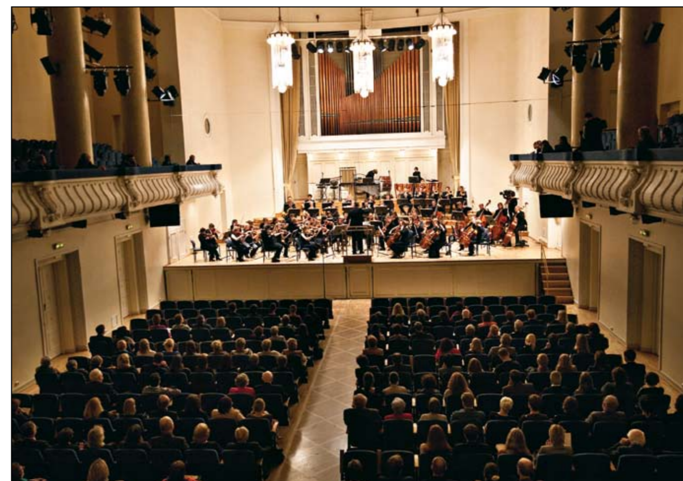
Musikhögskolans symfoniorkester under finalkonserten i Estonia konsertsal i Tallinn: en fantastisk, minnesvärd konsert!

got försenade till middagen. Att manövrera bussar genom Vilnius smala, enkelriktade gränder visade sig dessutom vara en utmaning utöver det vanliga. Likväl: det gick! Vi hittade fram till filharmonin och, bland alla byggställningarna backstage, omklädningsrummen. Orkestern packade upp, vi ställde i ordning, och vi höll ett effektivt sound-check på den nyrenoverade scenen. Det kändes riktigt skönt att ha landat med orkestern, att se alla på plats och höra dem spela. Jag får också veta att det väntas stor publik, uppskattningsvis 500 personer (av cirka 700 platser) – verkligen i alla åldrar, och bland dem några litauiska ministrar. Kul!