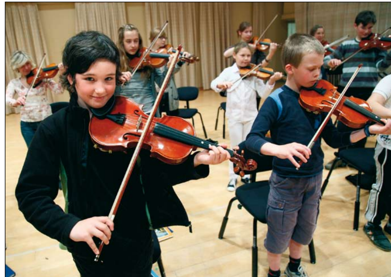
Fullt fokus på instrument och stråke blir det under ett gemensamt arbetspass i Rosenbergsalen på Musikhögskolan.

lan i Malmö, arrangeras även en kurs i norska Trysil, där alla skidsugna stråkelever kan få sitt lystmäte både vad gäller musicerande och skidåkning. Den veckan handlar det således mycket om att delta-garna, med hjälp av harts och skidvalla, jobbar med att minska respektive öka friktionen mot respektive underlag.