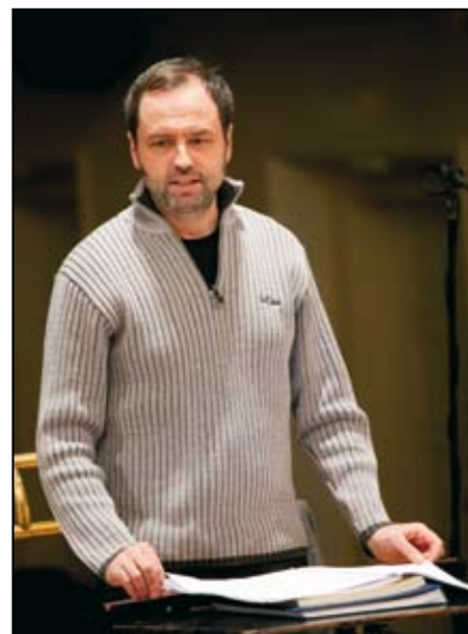
Kompositören Tõnu Kõrvits älskade orkestern!

soundcheck i Estonia konsertsal – en underbart vacker konsertsal med kristallkronor i taket och utmärkt akustik – ett soundcheck inför TV-kameror, radioinspelning och med intervjuer av dirigent och solist. Sammantaget inramningen och orkestrens laddning inför final gjorde en helt fantastisk avslutande konsert (jag log hela Stenhammar!). En stor och